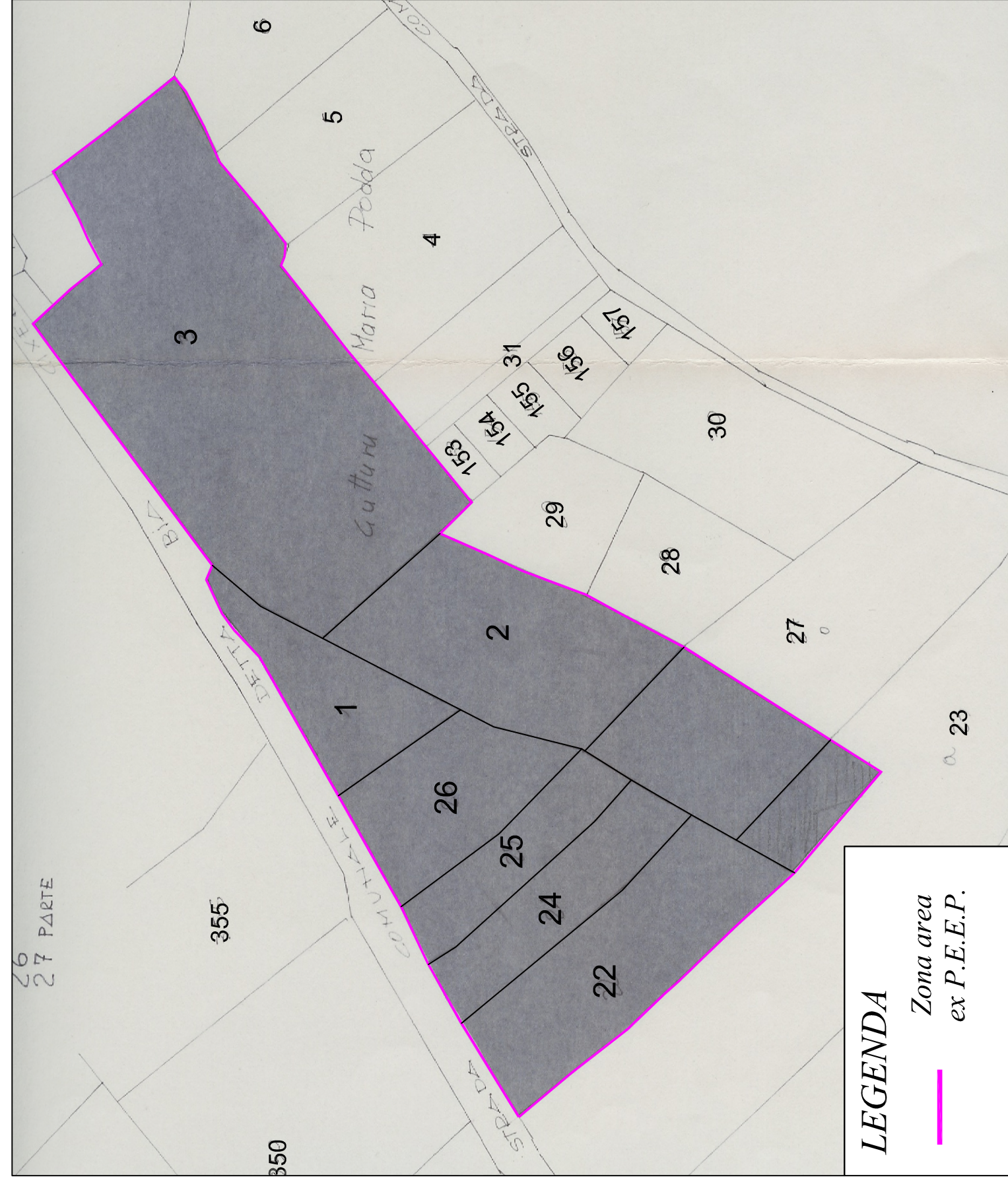
Stralcio Catastale area ex P.E.E.P.